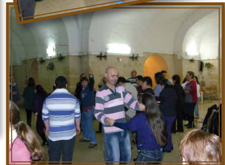
Membri u mistiedna jiehdu gost flimkien waqt id-disco tal-Milied 2009 li sar fis-sala ta' taħt il-Knisja ta' Santa Rita, il-Belt Valletta.