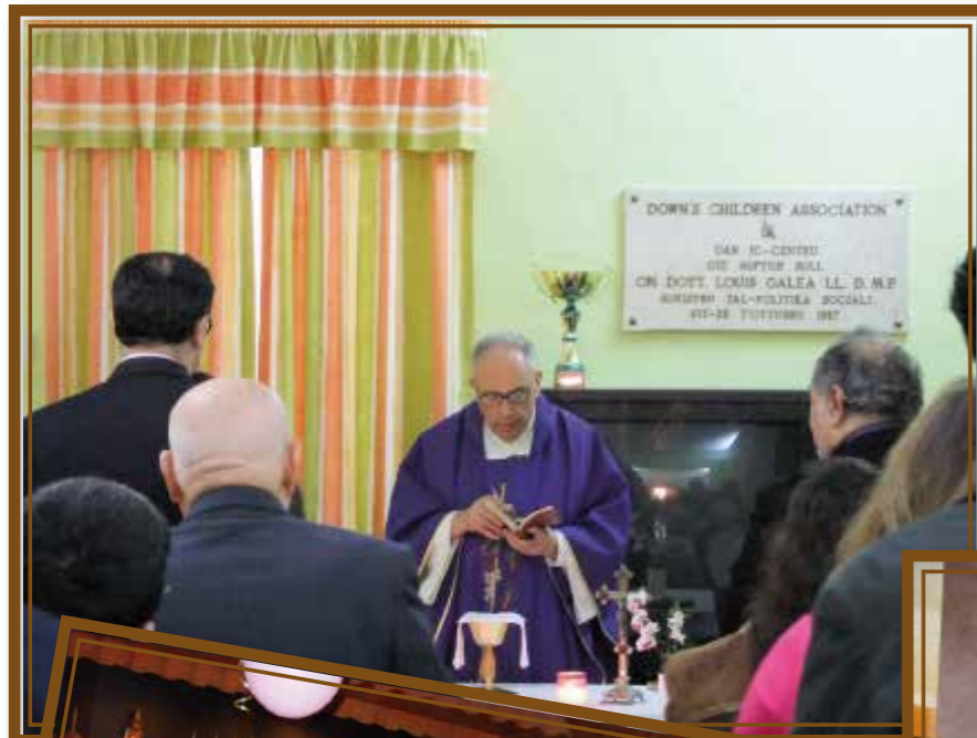
Mons. Lawrence Gatt iqaddes il-quddiesa tat-tifikira tal-'Jum Dinji tad-Down Syndrome'