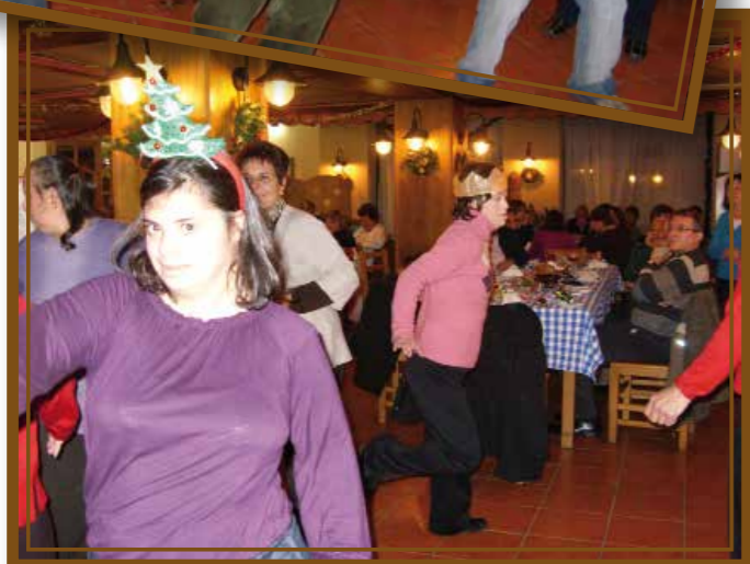
Membri u mistiedna jipparteċipaw u jgawdu l-briju li kien hemm waqt l-ikla tal-Milied 2009 li saret fi-Lukanda Canifor, Bugibba.